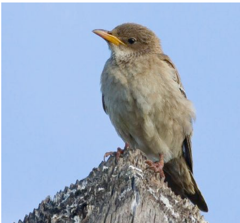
Etourneau roselin Sturnus roseus , 1 ère année, octobre 2014, Vias (F. Barszezak).

dans l'année : du 16 mars au 25 octobre avec des observations également en début d'été : le 30 mai et le 5 juillet.