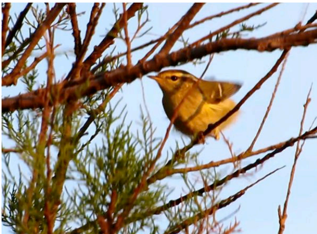
Pouillot à grands sourcils Phylloscopus inornatus , octobre 2014, Frontignan (C. Haag).