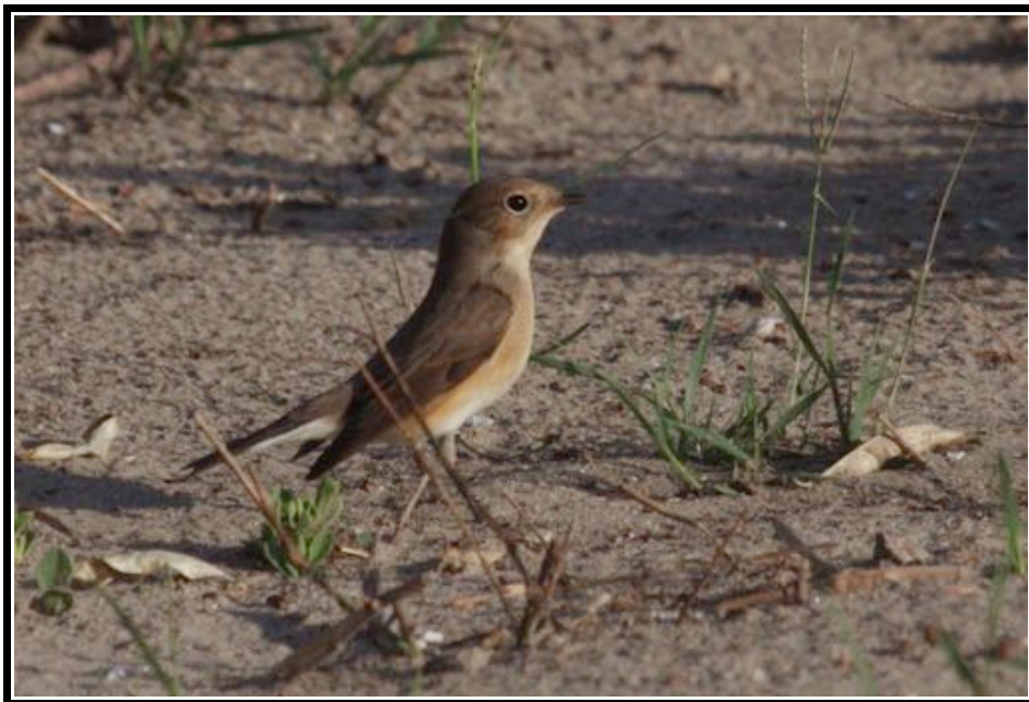
Gobemouche nain Ficedula parva , 1 ère année, Frontignan, septembre 2014 (B. Nabholz).