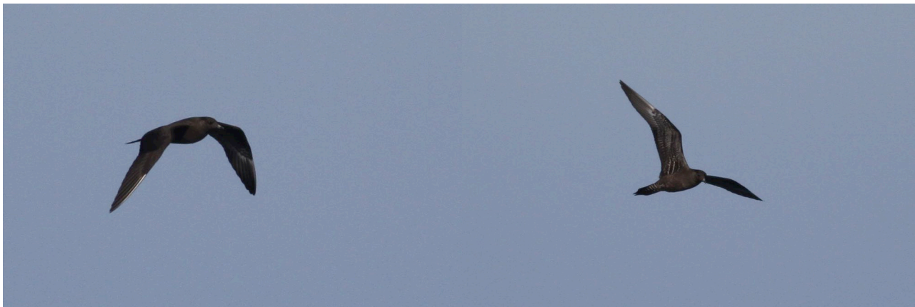
Labbe à longue queue Stercorarius longicaudus , 1 ère année (forme sombre), septembre 2014, golfe du Lion.

Migrateur occasionnel. Encore une donnée glanée à la faveur d'une sortie en mer, cette fois-ci au moment de la migration postnuptiale.