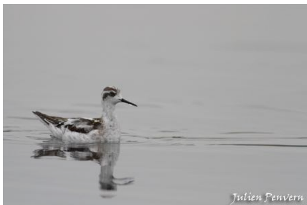
Phalarope à bec étroit Phalaropus lobatus , 1 er hiver, octobre 2014, Gruissan (J. Penvern).

Migrateur postnuptial rare. Alors que le Languedoc-Roussillon possède des milieux favorables à la halte migratoire de cette espèce, celle-ci reste vraiment rare (plus rare que le Bécasseau tacheté C. melanotos par exemple), notamment si on compare la situation régionale avec les observations effectuées tous les ans en Camargue.