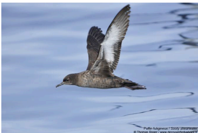
Puffin fuligineux Puffinus griseus , mai 2014, golfe du Lion.

Hivernant/erratique occasionnel. S'agit-il de l'oiseau observé en décembre 2013 au large de la Grande Motte ? A moins que l'espèce ne soit annuelle en tout petit nombre, au large de nos côtes... Elle redeviendrait « visible » grâce aux sorties en mer naturalistes organisées ces dernières années au départ de la Grande-Motte ou de Canet-en-Roussillon (Oliosio 2015).