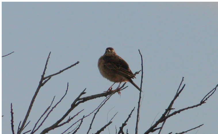
Pipit de Richard Anthus richardi , mai 2014, Canet-en-Roussillon (J. Piette).