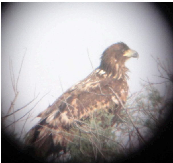
Pygargue à queue blanche Haliaeetus albicilla , 1 er hiver, octobre 2013, Vauvert.

Hivernant occasionnel. La Camargue gardoise a accueilli un nouvel individu en 2013. Il s'agit de la quatrième donnée homologuée de l'espèce dans le département. Les 2 seules autres données enregistrées depuis 2006 proviennent de l'Aude et des Pyrénées-Orientales et concernent peut-être le même individu.