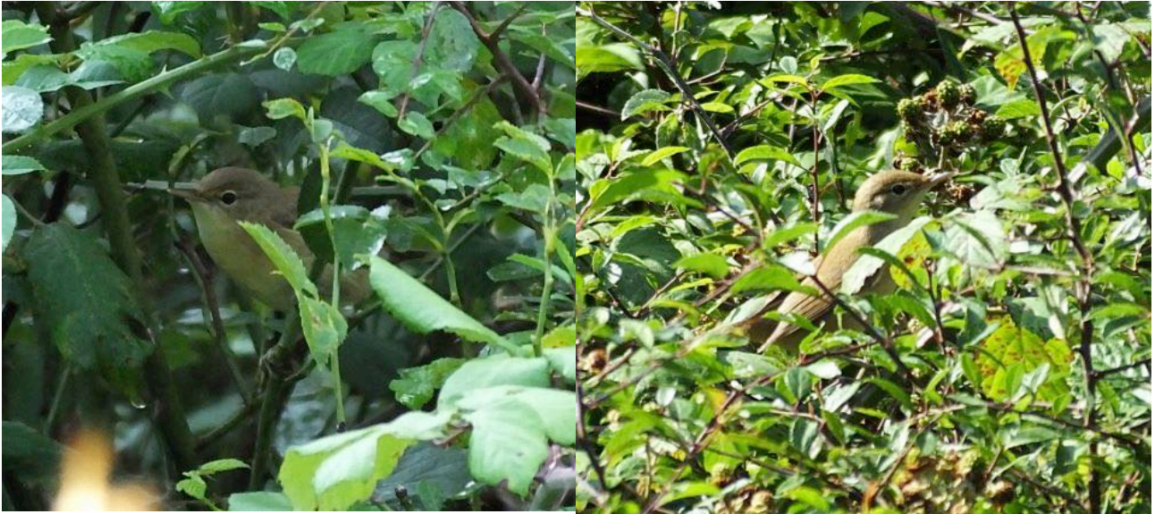
Rousserolle verderolle Acrocephalus palustris , août 2014, Ceilhes- et-Rocozeles (F. Legendre).