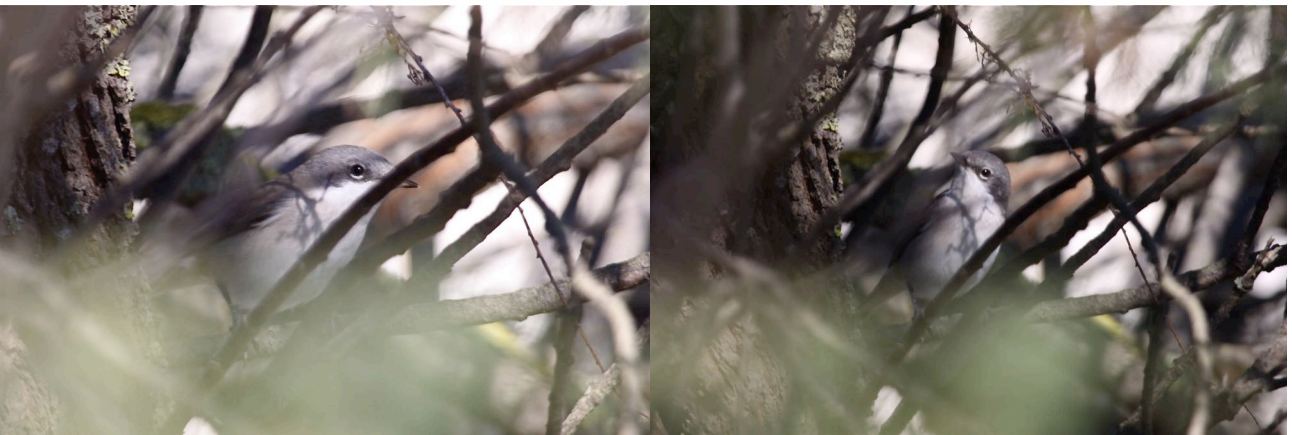
Fauvette babillarde Sylvia curruca , septembre 2014, Frontignan (Y. Ponthieux).

Ces deux photographies « réalistes » illustrent parfaitement la première impression que donne l'espèce sur le terrain : celle d'une petite fauvette assez ronde et très blanche dessous. Face à ce type d'oiseau, il faut d'abord écarter la possibilité d'une fauvette méditerranéenne, en particulier d'une femelle de Fauvette mélanocéphale Sylvia melanocephala . Pour cela, il faut s'assurer de l'absence de roux aux tertiaires (non visible ici) et essayer de bien voir le cercle oculaire : il est rouge orangé chez melanocephala ou cantillans , nettement blanc (parfois absent) chez curruca . Enfin, et surtout, ne pas oublier de noter la couleur des parties nues : les pattes et le bec sont sombres, presque noirs, ce qui est bien visible ici. Le bec assez court est nettement plus fort que celui des petites fauvettes méditerranéennes. La coloration gris plus sombre des parotiques n'est pas toujours facile à voir (le contraste est visible sur la photo de droite mais pas sur celle de gauche). Ajoutons que lorsque la taille de l'oiseau est difficile à juger, la confusion avec une Fauvette orphée S. hortensis doit également être envisagée.